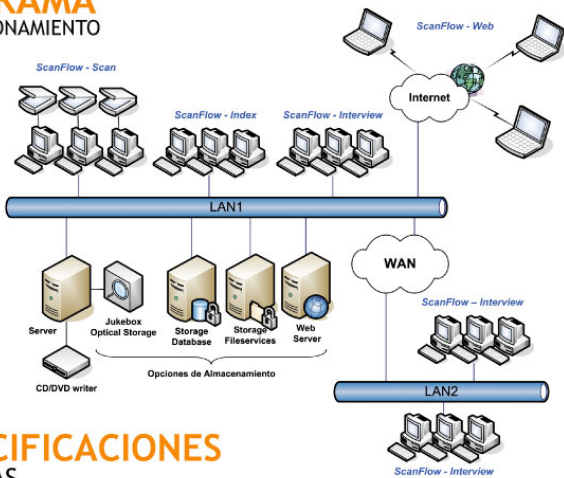
DIAGRAMA DE FUNCIONAMIENTO